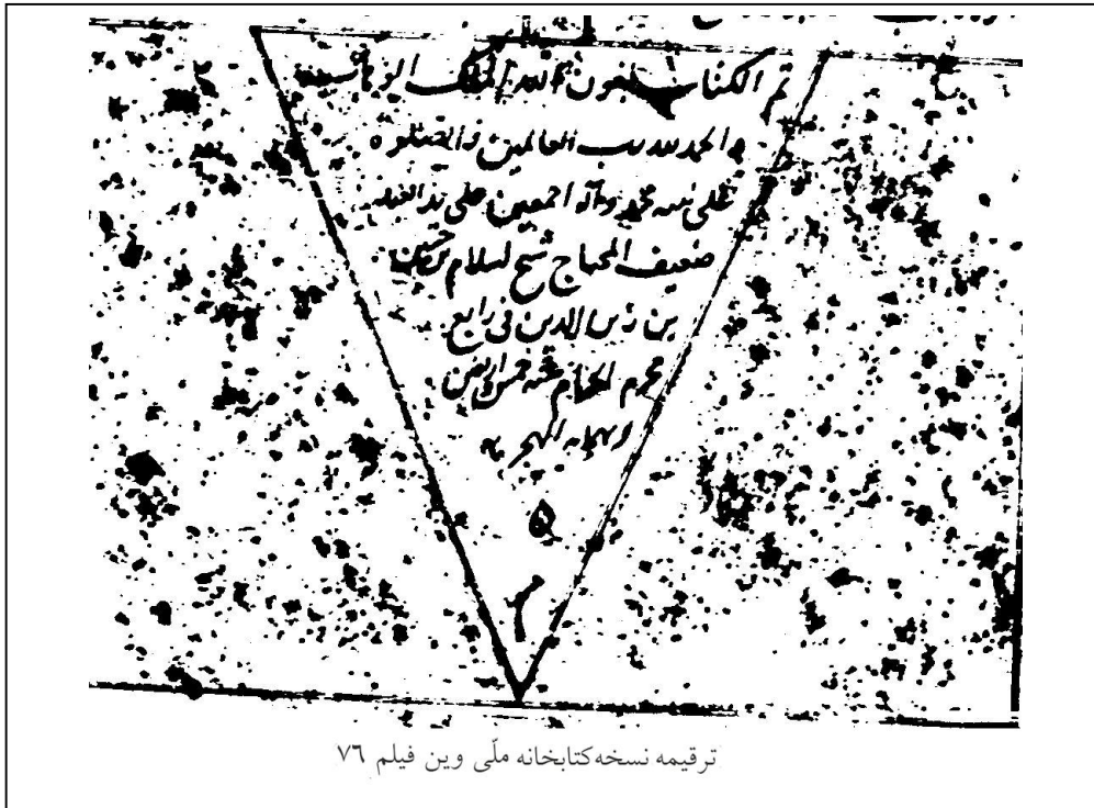
ترقیمه نسخه کتابخانه ملی وین فیلم ۷۶