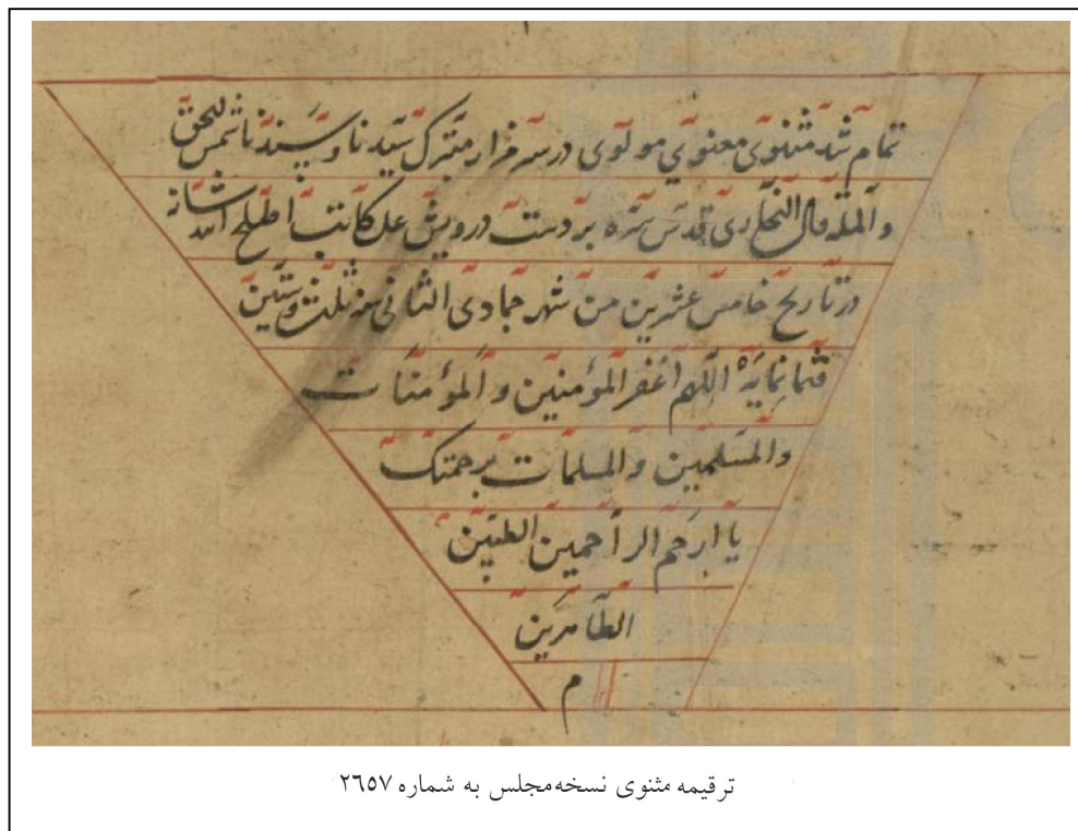
ترقیمه مثنوی نسخه مجلس به شماره ۲۶۵۷