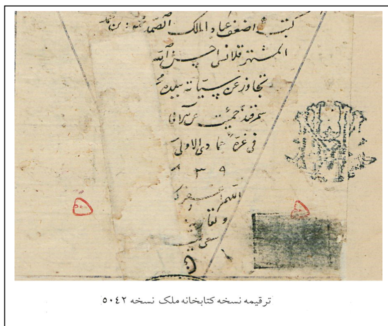
ترقیمه نسخه کتابخانه ملک نسخه ۵۰۴۲